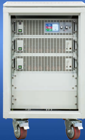
EA-EL 9000 B 15U