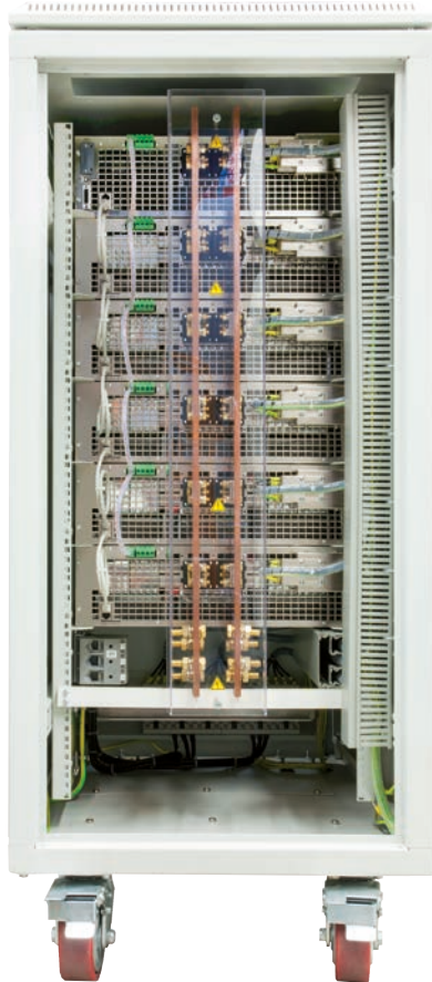
Rückansicht 24HE 90 kW