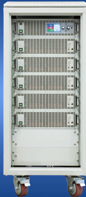
EA-EL 9000 B 24U