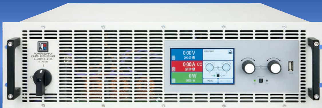
EA-PSI 9200-210 WR 3U

Источники питания с высоким КПД и расширенным AC входом High efficiency DC Power supplies with extended AC input range